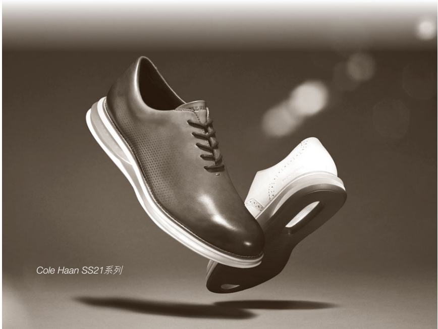
Cole Haan SS21系列

本集團正經歷最嚴峻的處境，儘管如此，我們預計製造業務將於二零二一年下半年開始逐步增長。