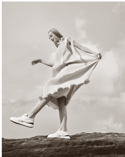
AMEDEO TESTONI SS21系列